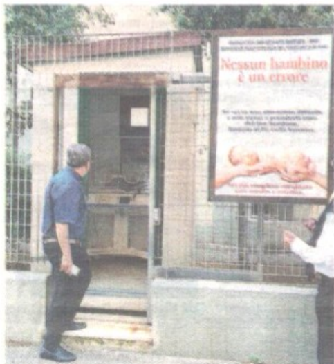
BARI La chiesa dove è stato lasciato il bimbo: la culla termica