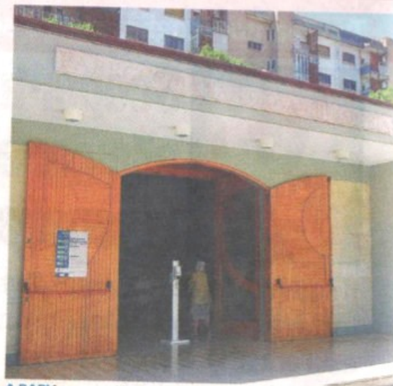
A BARI La parrocchia di San Giovanni Battista

Sta bene il neonato abbandonato a Bari: ha 9 giorni, figlio di italiani